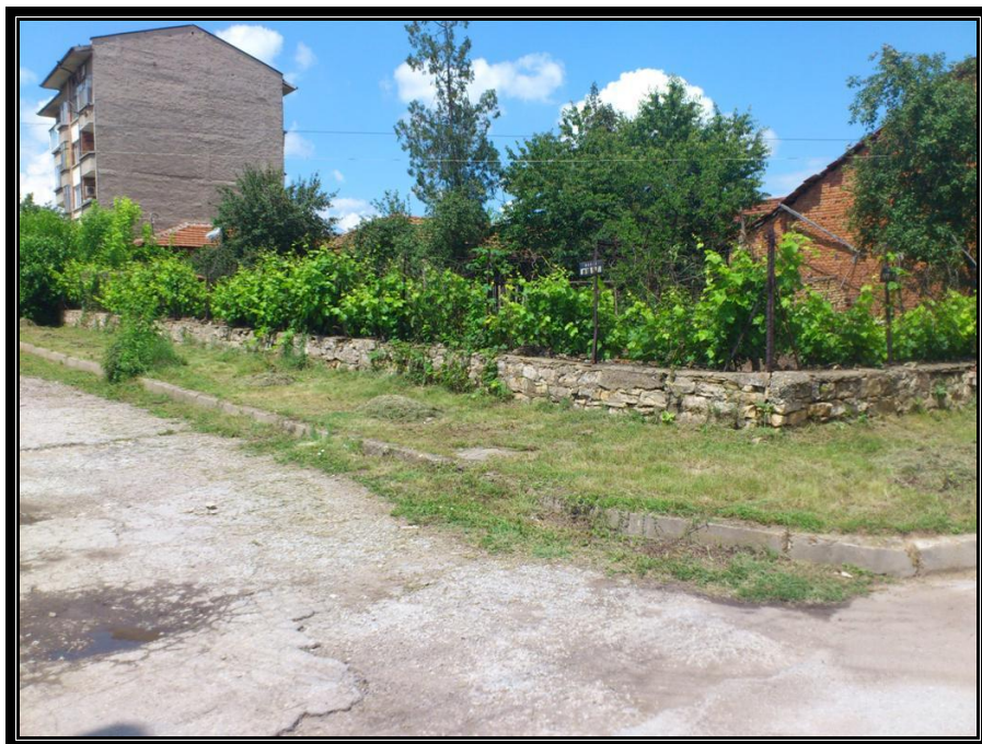
Кръстовище с ул.Кирил и Методий